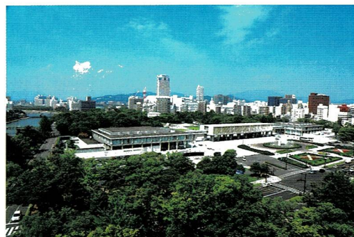
広島国際会議場 フェニックスホール 広島市中区中島町 1-5 TEL082-242-7777